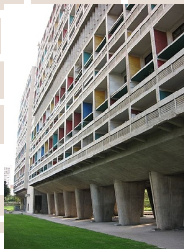
Rysunek 26. Le Corbusier Unite d'Habitation , Marsylia, Francja