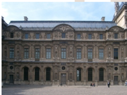
Rysunek 9. P. Lescot, zachodnie skrzydło Luwru, Paryż, Francja

się elementy bogatej ornamentyki i zestawienia form wzbogaconych procesem światłocienia. Już pierwsze cechy baroku widoczne są w dziełach Michała Anioła, który wprowadził elementy dynamiczne. Dzielił wielkie powierzchnie różnorodnymi formami, wprowadził także podział fakturowy. Poprzez odpowiednio kształtowane powierzchnie. Michał Anioł wprowadza do swoich budowli światło, będące także elementem ożywiający budynki, potęguje wrażenie ruchu. Kontynuatorami jego założeń byli niewątpliwie Giacomo della Porta i Domenico Fontana, którzy po śmierci mistrza ukończyli budowę kopuły bazyliki św. Piotra w Rzymie. Giacomo della Porta, po śmierci Vignoli przeprojektował fasadę i ukończył kościół Il Gesù w Rzymie, dzieło omówione poniżej.