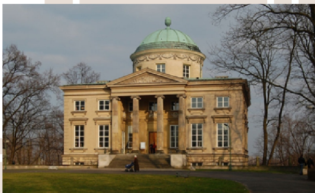
Rysunek 15. D. Merlini, Królikarnia, Warszawa

Przykładem architektury palladiańskiej jest Chiswick House lorda Burlingtona, wzorowany na Villa Rotonda. Występują liczne odniesienia i dosłowne nawiązania, widoczne w obu dziełach. Budowle wzniesione są na planie kwadratu, z okrągłą salą pod kopułą i czterema portykami jońskimi. Innym przykładem kontynuacji założeń Andrea Palladio jest polska budowla, która w sposób dosłowny realizuje założenia palladianizmu, nurtu klasycystycznej architektury, która sprzeciwia się przepychowi baroku i rokoko.