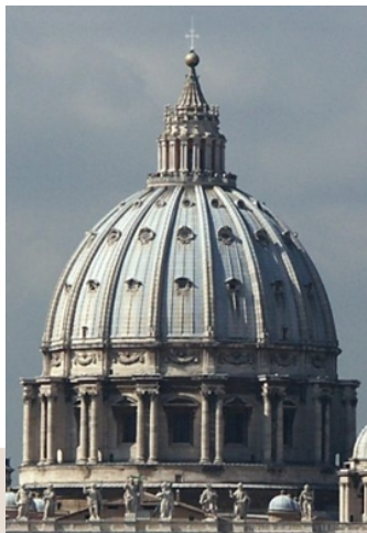
Rysunek 11. Michelangelo Buonarroti, kopuła bazyliki św. Piotra, Rzym, Włochy

historycznym tego okresu gdzie widoczny jest rozwój nauk humanistycznych i ścisłych, a przemiany społeczne w postaci bogacenia się i umacniania pozycji społecznej klasy mieszczańskiej widoczne są także w sposobie kreowania przestrzeni.