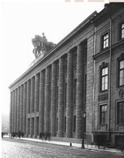
Rysunek 1. Peter Behrens, Niemiecka Ambasada, Sankt Petersburg

funkcja. Związek ten powoduje reakcję tzw. powolnego czytania budynku. Koncepcja ta była stworzona i popularyzowana przez architekta Stanisława Fiszera (fr. de la lectrure lente). W jej myśl obiekt i jego elementy projektowane są w sposób mający na celu zmianę postrzegania przestrzeni i zaspokojeniu estetycznej przyjemności. Koncepcja ta realizowana jest za pomocą wyuczonych narzędzi, rzemiosła, ślusarki, obróbki kamienia czy szalowania betonu. Zgodnie z teorią architekta, wzorem obiektów są dwa budynki: niemiecka ambasada Petera Behrens'a w Sankt Petersburgu i biblioteka Gunnara Asplund'a w Sztokholmie. Prezentowane budynki dzięki detalom wpisują się w koncepcję powolnego czytania budynku. Sztuka projektowania obiektów budowlanych widoczna jest nie tylko w samej formie, ale także w precyzji każdego szczegółu.