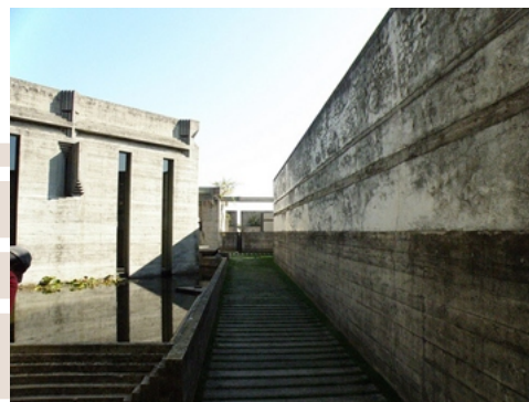
Rysunek 20. Carlo Scarpa, Brion Tomb, San Vito d'Altivole, Italy