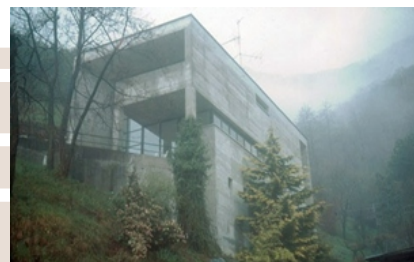
Rysunek 24. Luigi Snozzi, Dom wakacyjny Kalmann w Brione s/Minusio, Szwajcaria