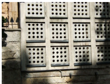
Rysunek 3. Bohdan Pniewski, Willa przy ul. Klonowej, Warszawa, detal

Źródło: http://warszawa.sarp.org.pl/pokaz.php?id=1713 , detal architektoniczny, jako główny element definiujący projektowane założenie