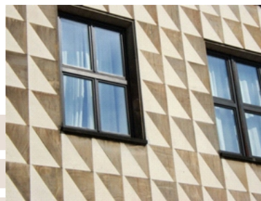
Rysunek 4. Bohdan Pniewski, Gmach Sądów Grodzkich, Warszawa, detal od ul. Ogrodowej

detal architektoniczny, jako główny element definiujący projektowane założenie