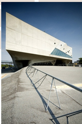
Rysunek 25. Zaha Hadid Phäno – Muzeum Nauki, Wolfsburg, Niemcy

Współcześnie bardzo charakterystyczną postacią świata architektonicznego jest Zaha Hadid. W wielu jego działaniach można zaobserwować odniesienia do modernistycznego podejścia Le Corbusiera. Przykładem jest budynek Phäno Muzeum Nauki w Wolfsburgu.