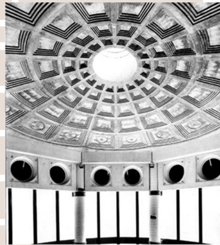
Rysunek 6. Stanisław Fiszer, Teatr i Mediateka, Saint-Quentin-en-Yvelines, Francja kreacja przestrzeni dzięki detalom architektonicznym