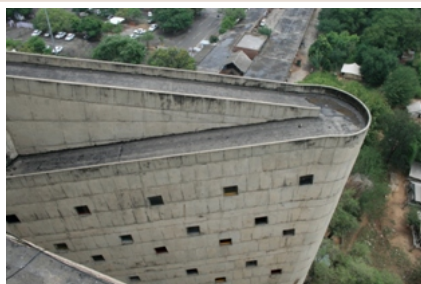
Rysunek 21. Le Corbusier, Budynek administracyjny, Chandigarh, India