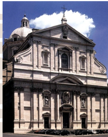
Rysunek 12. Jacopo Barozzi da Vignola, Kościół Najświętszego Imienia Jezus, Rzym (wł. Chiesa del Gesù)

Źródło: http://www.historiasztuki.com.pl/001_KANON_REN_ARCH.html , wyrażna inspiracja kopułą katedry Santa Maria del Fiore projektu Filippo Brunelleschiego