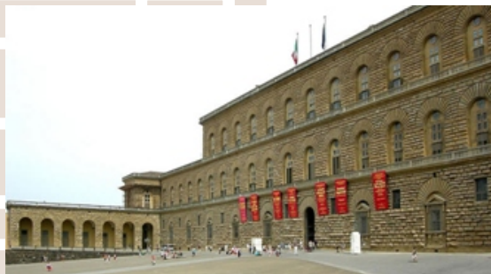
Rysunek 10. B. Ammanati, Palazzo Pitti (projekt przypisywany również Albertiemu), Florencja, Włochy

przykład architektury renesansowej, zastosowana forma klasyczna połączona z francuską tradycją, widoczna harmonijna artykulacja elewacji uzyskana przez zastosowanie ryzalitów, rytmy okien prostokątnych, okien zwieńczonych półwałnymi frontami oddzielonymi pilastrami, arkad w parterze, elewacja ma charakter rzeźbiarski, nowe elementy zastosowane w niszach i zwieńczeniach ryzalitów