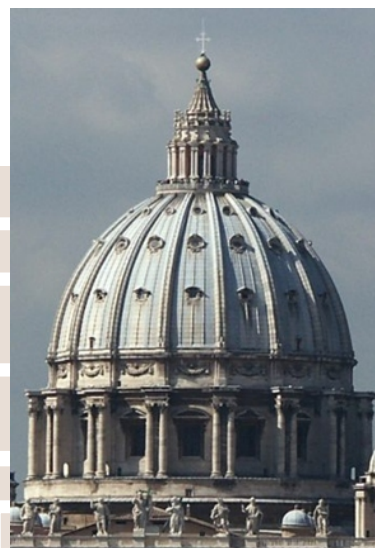
Rysunek 8. Michelangelo Buonarroti, kopuła bazyliki św. Piotra, Rzym, Włochy

prezbiterium zaprojektowane na planie ośmioboku przykryte ośmiobocznym, dwupowłokowym sklepieniem zwieńczonym latarnią, kopuła pokazuje inżynierski kunszt i jest początkiem pracy nad modelem przestrzennym