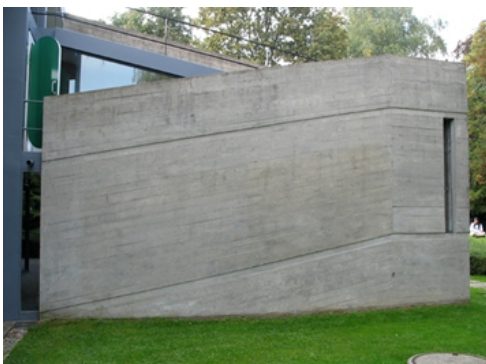
Rysunek 19. Le Corbusier, Heidi Weber Pavilion, Zurich, Switzerland