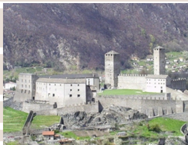
Rysunek 22. Aurelio Galfetti, zamek Castelgrande, Bellinzona, Switzerland