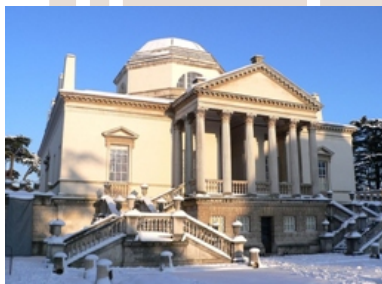
Rysunek 13. Richard Boyle, Chiswick House, Londyn, Wielka Brytania

obiekt stanowi zapowiedź nowego stylu w architekturze – baroku, odchodzi w swojej formie i wyrazie od harmonii i ładu tak bardzo cenionego w czasie renesansu