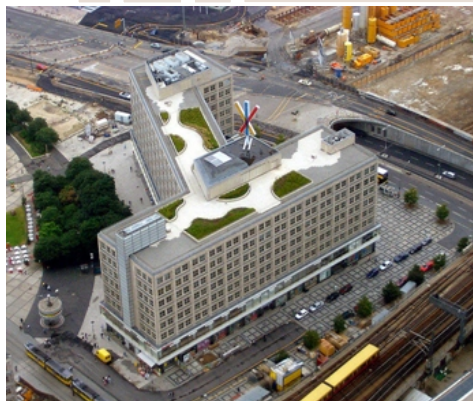
Rysunek 17. P. Behrens, Alexanderhaus, Berlin, Niemcy,

Le Corbusier stworzył ideę praktycznego zastosowania betonu (fr. Béton brut), widoczną w założeniach Unite d'habitation w Marsylii czy budowlach w m. Czandigarh. Liczne nawiązania nowych projektów Petera Behrensa są widoczne w obiektach Le Corbusiera.