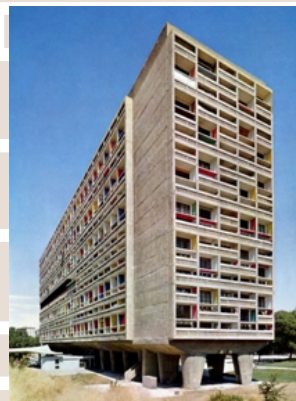
Rysunek 18. Le Corbusier, Unite d'habitation, Marsylia, Francja,