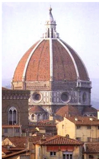
Rysunek 7. Filippo Brunelleschi, kopuła katedry Santa Maria del Fiore, Duomo, Florencja, Włochy

prezbiterium zaprojektowane na planie ośmioboku przykryte ośmiobocznym, dwupowłokowym sklepieniem zwieńczonym latarnią, kopuła pokazuje inżynierski kunszt i jest początkiem pracy nad modelem przestrzennym