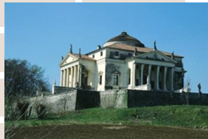
Rysunek 14. A. Palladio, Villa Rotonda, Vicenza, Włochy

nawiązuje formą i charakterem do projektu A. Palladio, Villa Rotonda