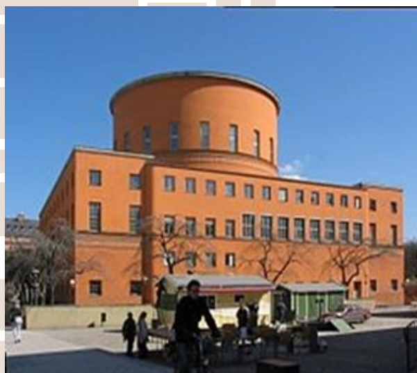
Rysunek 2. Gunnara Asplund'a, Biblioteka, Sztokholm

Źródło: http://www.google.pl , obiekt dzięki zastosowanym detalom architektonicznym wpisuje się w teorię „de la lectrure lente”