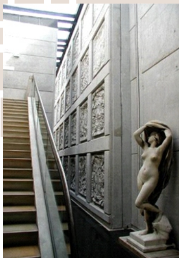
Rysunek 5. Stanisław Fiszer, Centrum Studiów i Poszukiwań przy Archiwach Narodowych (C.A.R.A.N.), Paryż, Francja detal architektoniczny widoczny w każdym elemencie projektów Stanisława Fiszera

Architekt Stanisław Fiszer kontuuje myśl Bohdana Pniewskiego. Detal architektoniczny jest świadomą decyzją ekonomiczną architekta. Fiszer koncentruje się na szczegółach odchodząc od kreowania architektury przez jej strukturę.